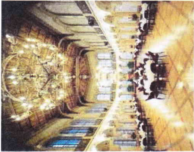
Der große Ferstelsaal